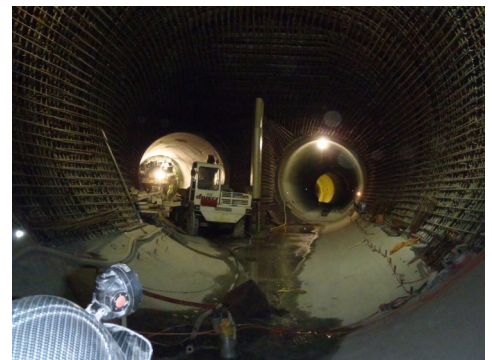
图 2: 监测方位的传感器