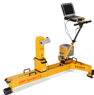
图 2: Amberg GRP3000 系统

一家名为 Amberg 的公司，位于苏黎世 ( Zurich ) 附近的雷根斯多夫(Regensdorf)，在他们名为 GRP3000 的测量系统中使用了 Dimetix 传感器。Dimetix 激光测距传感器集成于该设备中，固定在安装支架上，该系统不仅可以进行