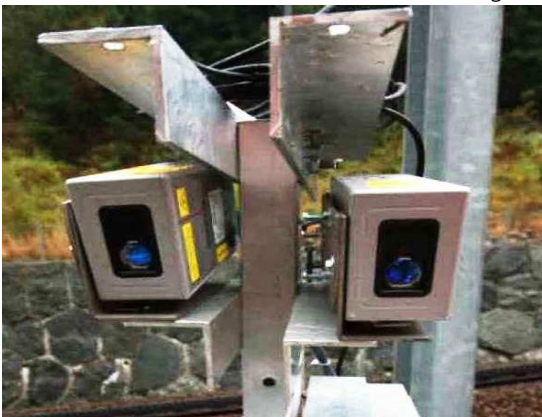
Abb 1: Dimetix Sensoren im Einsatz

Dimetix Sensoren werden zur Überwachung einer aktiven Felsformation, welche zu einem Aufstau eines Bergflusses