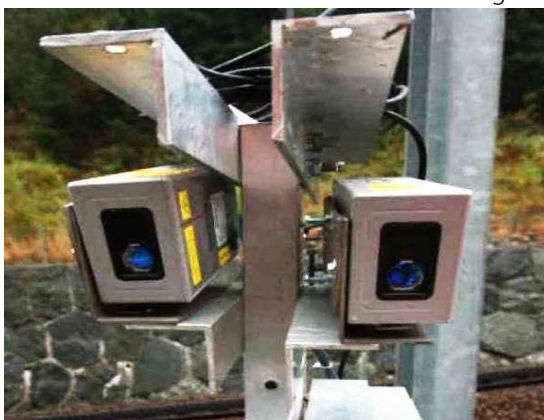
Abb 1: Dimetix Sensoren im Einsatz

Dimetix Sensoren werden zur Überwachung einer aktiven Felsformation, welche zu einem Aufstau eines Bergflusses führt, eingesetzt. Beim Aufstau kann es zur Überflutung eines Bahngleises kommen. Beide Laser messen auf eine Distanz von rund 25 m. Sobald eine bedeutend kürzere Messdistanz auftritt, oder ein Messfehler vorkommt, wird über einen Datalogger mit GSM-Mobile ein Alarm ausgegeben. Die Laser sind Teil eines grösseren Dispositives, welches eine Rutschaktivität und ein Murgang-Gerinne überwacht. Unter anderem werden auch Webcams eingesetzt. In den letzten Jahren ist es zu drei Ereignissen gekommen, die mit dem Alarm dispositiv und den dazugehörigen Massnahmen schadlos bewältigt werden konnten. Die Installation wurde im Herbst 2010 installiert und läuft seit dieser Zeit problemlos. Das Messintervall der Laser beträgt fünf Minuten. Die ganze Anlage wird mit Strom betrieben, hat aber ein Sonnenpanel und einen Akku, damit die Stromversorgung jederzeit garantiert ist.