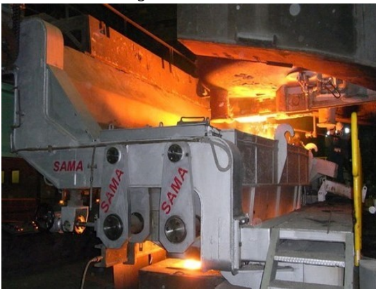
Abb 1: Stahlwerk

Diese Anwendung kontrolliert und überwacht das Befüllen und den Ausguss von geschmolzenem Stahl und Eisen in einer Giesserei. Dabei wurden Dimetix Laser Distanz Sensoren installiert um den Füllstand vom flüssigen Stahl und Eisen zu messen. Somit wird ein Überlauf vermieden.