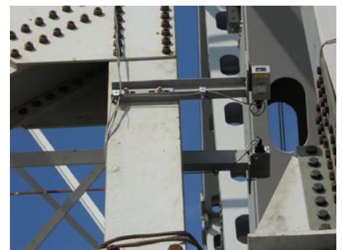
Abb 2: Laser Sensor montiert an Stahlkonstruktion

Für den Liftbetrieb war das laser-basierte Monitoring unerlässlich. Die Projektingenieure waren in der Lage sie in Echtzeit zu nutzen, um genau zu erfahren, was mit dem Aufzug geschah. Dadurch wurde es möglich "on the fly" Anpassungen an der Lage des Fachwerks ohne Verlangsamung des Betriebs vorzunehmen. Laut John Brestin, Vizepräsident und Brückengruppenleiter bei HNTB, erlaubte das System des weiteren auch die Überwachung des Fachwerks, während es seitlich in die Position über den Lagern glitt, was kritisch, wenn nicht kritischer als der Aufzug selbst, war.